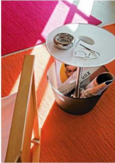
"CrissCross" diseño Eero Aarnio