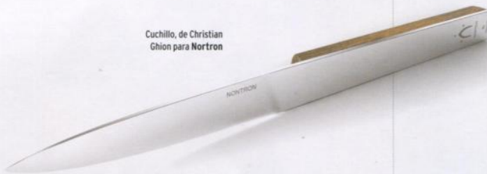
Cuchillo, de Christian Ghion para Nortron