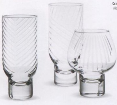
Cristaleria Reused History, de Tomas Krai para PCM