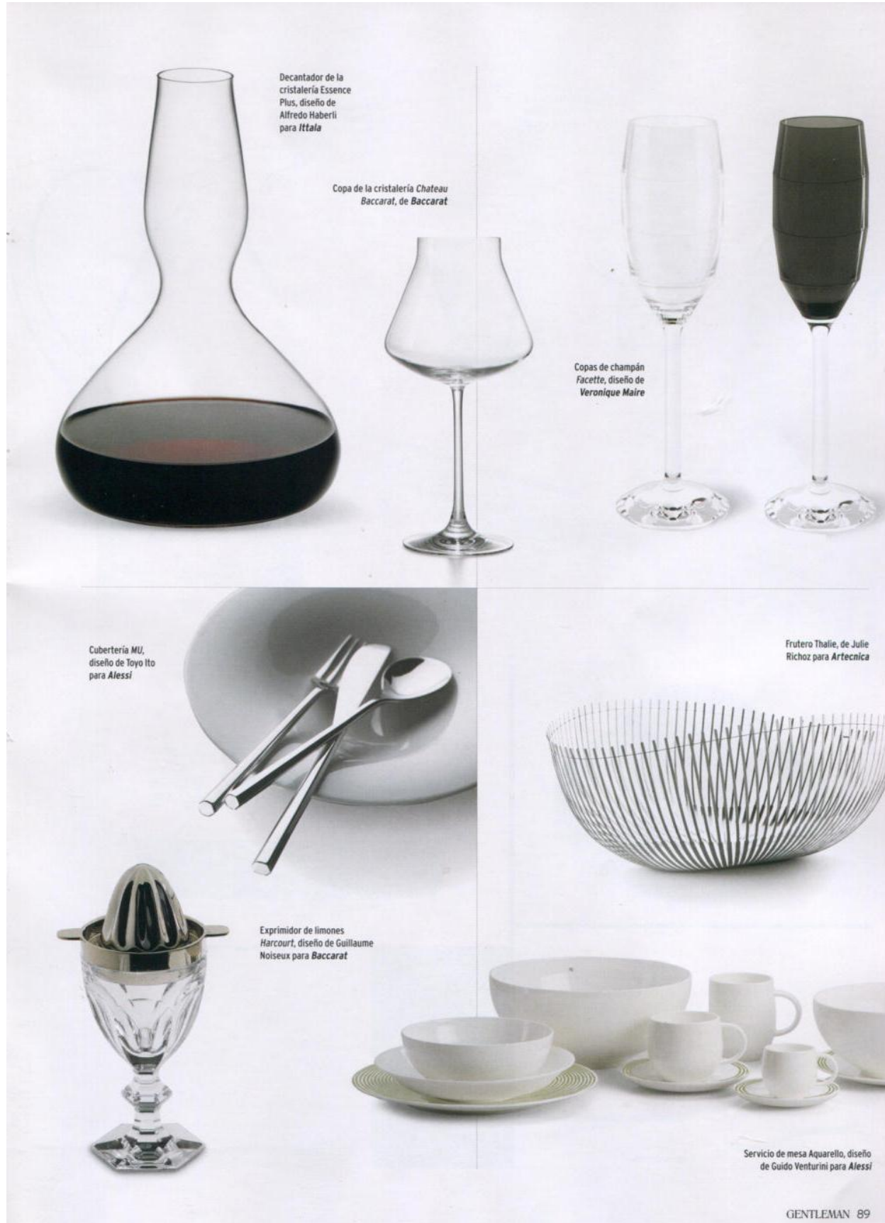
Decantador de la cristalería Essence Plus, diseño de Alfredo Haberli para Ittala